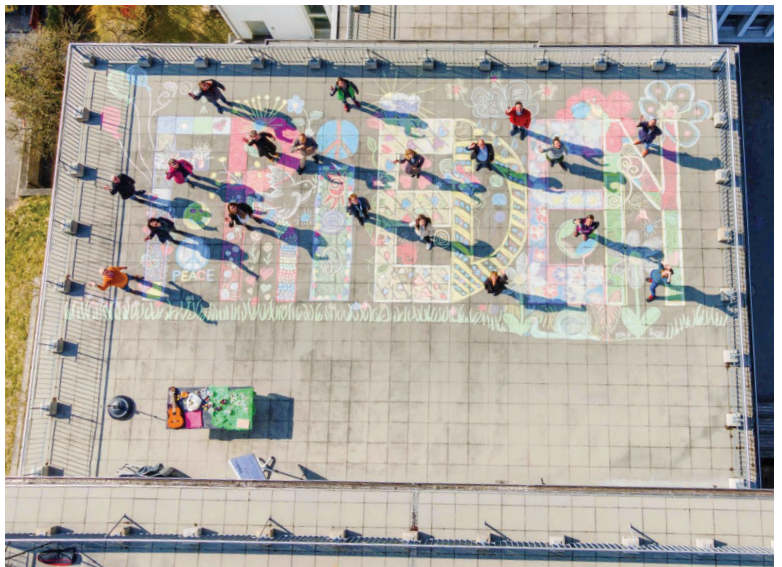
Frieden: Der gemalte Friedensgruss auf dem Dach des Landeskirche-Gebäudes am Abendweg 1 in Luzern.

Anschauen kann man sich den Friedensgruss auf dem Youtube-Kanal der Katholischen Kirche im Kanton Luzern oder über lukath.ch. Vielleicht inspiriert das Video zur Nachahmung oder zu anderen friedlichen, teambildenden Aktionen.