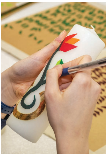
Die Bruder-Klaus-Osterkerze entsteht.