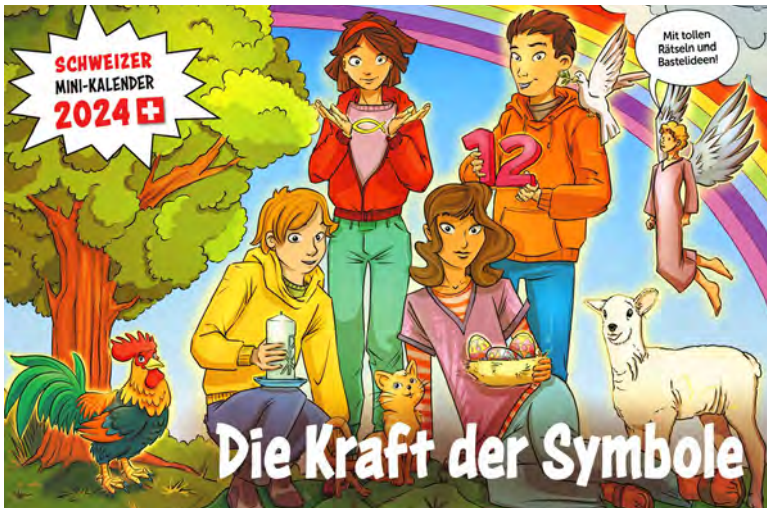
Der Mini-Kalender 24 vermittelt Wissen über religiöse Symbole. Bild: Mini-Kalender

Mo, 27.11., 18.15, Universität Luzern, Hörsaal 1